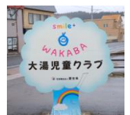
103号線の看板が目印